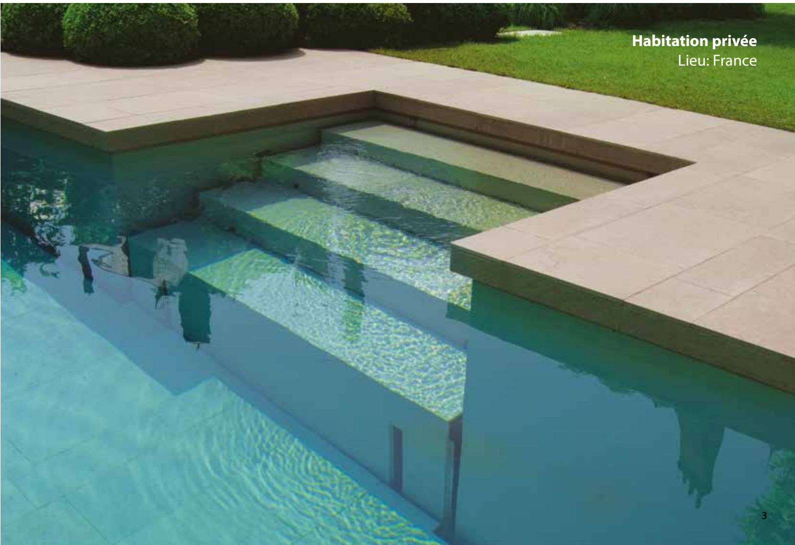
Habitation privée Lieu: France