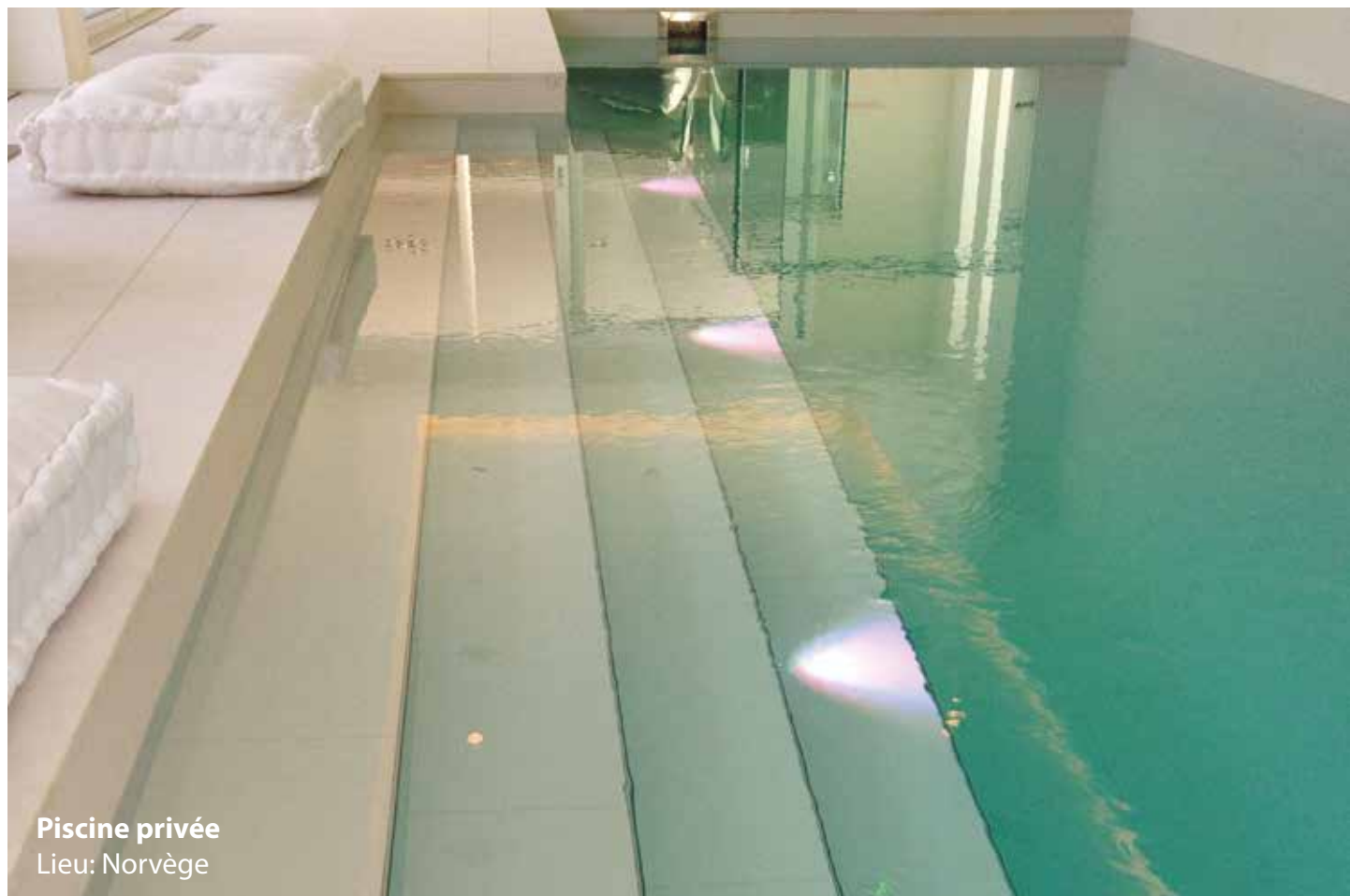
Piscine privée Lieu: Norvège

S'il s'agit de piscines d'eau salée ou thermale, il faudra employer des adhésifs et des mortiers de jointoiement particuliers.