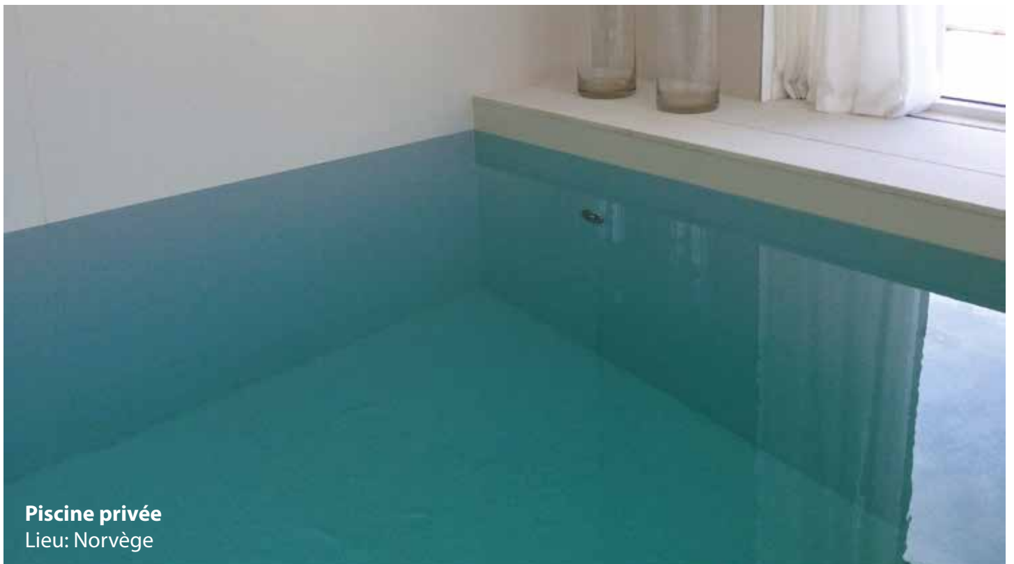
Piscine privée Lieu: Norvège