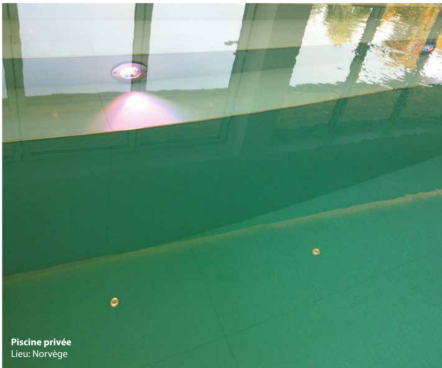
Piscine privée Lieu: Norvège

Les indications concernant les produits proposés ainsi que leur mode d'emploi ont été fournis directement par les fabricants. Pour plus d'indications, il sera possible de contacter directement les personnes de référence des différentes sociétés productrices que nous avons indiquées, dans la rubrique "adresses utiles".