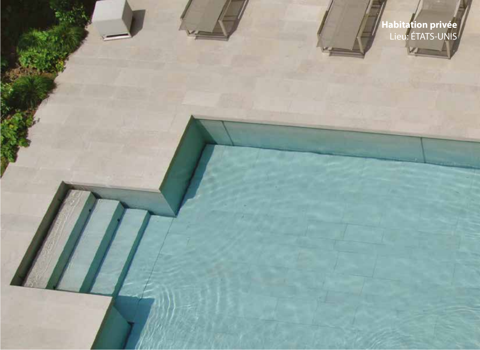
Habitation privée Lieu: ÉTATS-UNIS